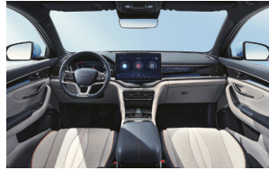
Kék és világos szürke